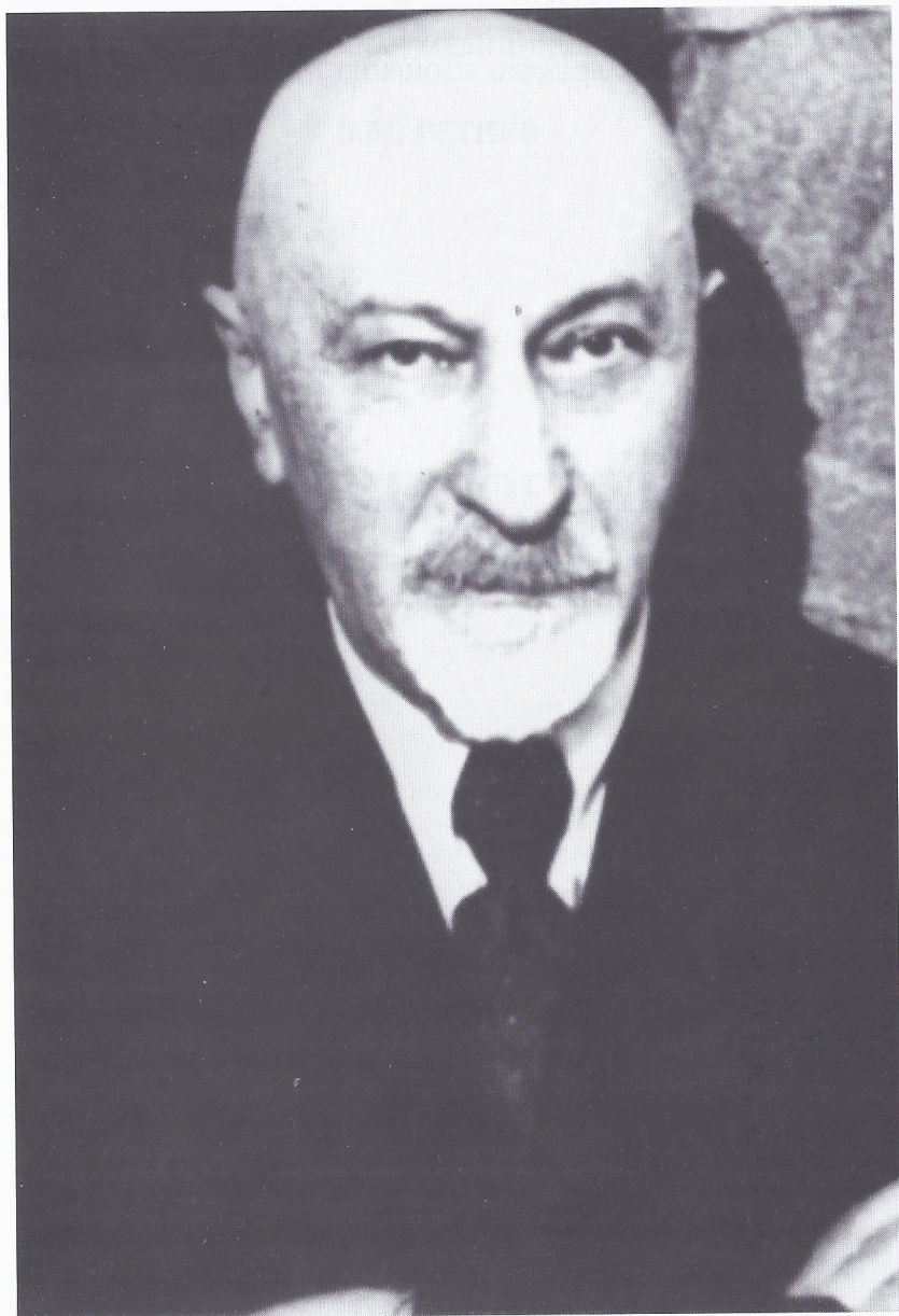
Н.А. Вигдорчик (1874–1954)